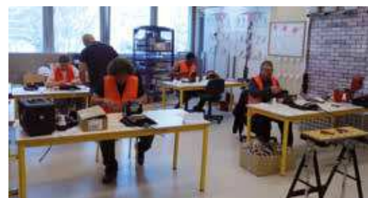
© Lycée Maryse Bastié (Limoges)

Les profils techniques (électricien, électromécanicien) sont très recherchés. À l'aide d'une formation complémentaire spécifique THD courte, il est possible d'élargir ses compétences pour intégrer les entreprises en charge du déploiement de la fibre sur leur territoire. Un projet professionnel de long terme, pour des perspectives d'embauches immédiates !