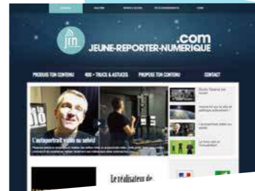
Le portail : www.jeune-reporter-numerique.com

DEPUIS AVRIL DERNIER, LE PORTAIL JEUNES REPORTERS NUMÉRIQUES EST EN LIGNE : WWW.JEUNE-REPORTER-NUMERIQUE.COM