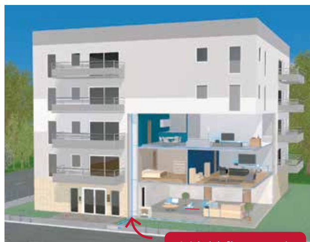
Arrivée de la fibre en souterrain

La fibre emprunte généralement le même chemin que le réseau télécom cuivre déjà en place quand il existe. S'il n'existe pas ou si ce passage n'est pas identifié, une solution est proposée par le technicien de raccordement.