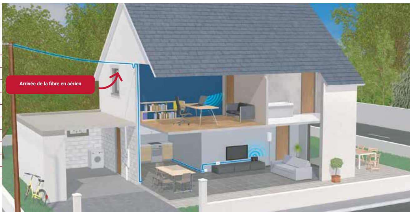
Arrivée de la fibre en aérien