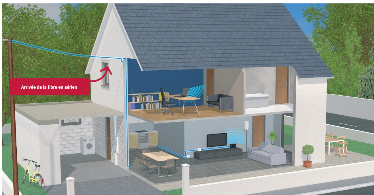
Arrivée de la fibre en aérien

La fibre emprunte généralement le même chemin que le réseau télécom cuivre déjà en place quand il existe. S'il n'existe pas ou si ce passage n'est pas identifié, une solution est proposée par le technicien de raccordement.