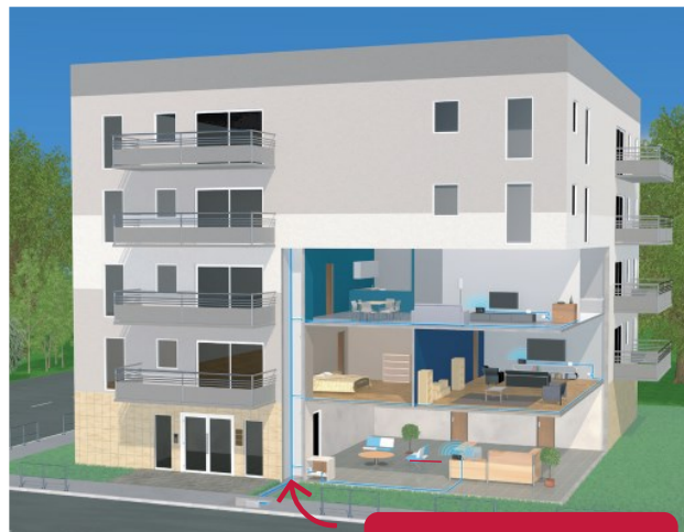
Arrivée de la fibre en souterrain

C'est l'abonnement qui déclenche le raccordement à la fibre du foyer ou du local d'activité (liste des opérateurs partenaires sur nathd.fr ). Une dernière section de fibre doit alors être déployée depuis le Point de Branchement Optique (PBO) le plus proche, situé dans la rue, à 150 m maximum, jusqu'à l'intérieur du logement ou du local. Ce raccordement final, aérien ou souterrain, est réalisé par NATHD ou par le Fournisseur d'Accès Internet (FAI) choisi, au moment de l'abonnement.